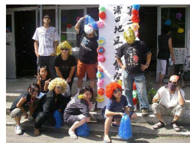
地域の芸能祭 みんなで出ちゃえば