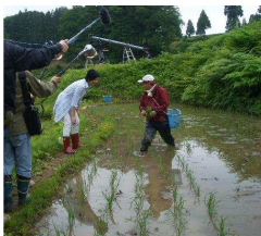
今年はなぜかカメラだらけ 小宮悦子さんも、苅谷俊介 さんも、武田鉄矢さんも、 新田にやってきました！