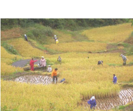
畦草刈り、田の草取り、 案山子づくり いくつ もの作業に汗して・・・ 10月 実りの秋 稲刈り