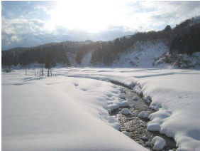
豊かな水はここから生まれる

信濃川の支流・渋海川を、その源流へとたどって行きます。 大河のみなもとの一滴まで、あと もう少しのところ、棚田だらけのここ、松之山。里山の気候風土とともに暮らす人々が、 生業・なりわいのなかでつくりあげてきた棚田は、たくさんの方の恵みと人々の知恵があふれていました。 自然の恵みに寄り添い、厳しさを静かに受け入れながら、米を作り続けてきた棚田。その景観とひとびとの英知は、少し ずつ、確実に、その姿を変えつつあります。