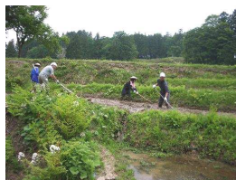
6月 代掻き へとへとどころ