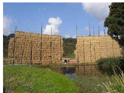
13段 はざ架け 稲穂のじゅうたん